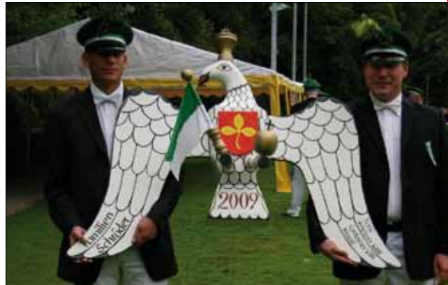
Noch ist der Vogel heil am Boden und wartet auf den treffsicheren Schützen, der in dieses Jahr abschießen wird.