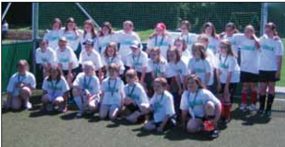
Auf dem Bild die Spielerinnen der Mannschaften vom Gymnasium Antonianum Geseke, der Realschule Salzkotten, Liborusschule Salzkotten und der Grundschule Verne-Verlar

Ein weiterer Höhepunkt des Jugendsportfestes war Abnahme des DFB-Fussballabzeichens. Erstmals wurde auch ein Mädchenturnier ausgetragen. Die Siegerinnen kommen vom Gymnasium Antonianum Geseke, die alle Spiele gewinnen konnten.