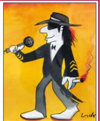
Udo Lindenberg Ausstellung bis zum 1. August 2010

Beratung außerhalb der Öffnungszeiten gerne nach Absprache.