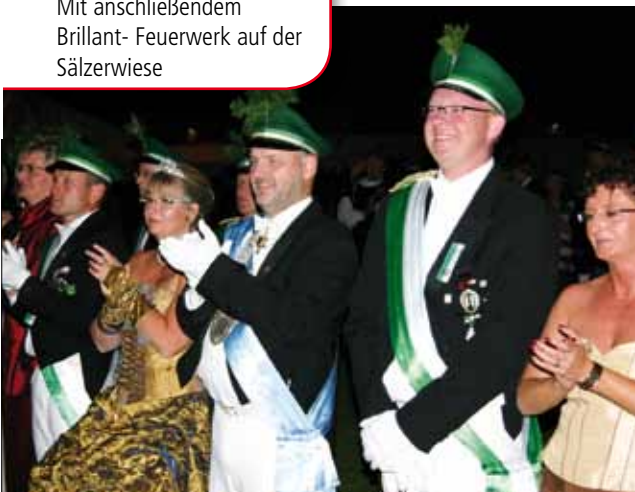
Zu Ehren des Königspaares und als Abschluss der Regentschaft wird der große Zapfenstreich und ein großes Feuerwerk zu bestaunen sein.