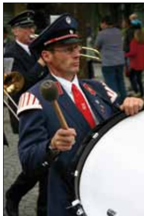
Musikalische Unterhaltung darf natürlich nicht fehlen.

Am 17. Juli ist es dann mal wieder so weit: Salzkotten wartet auf den neuen Schützenkönig! Wer wird dieses Jahr den Vogel runterholen?