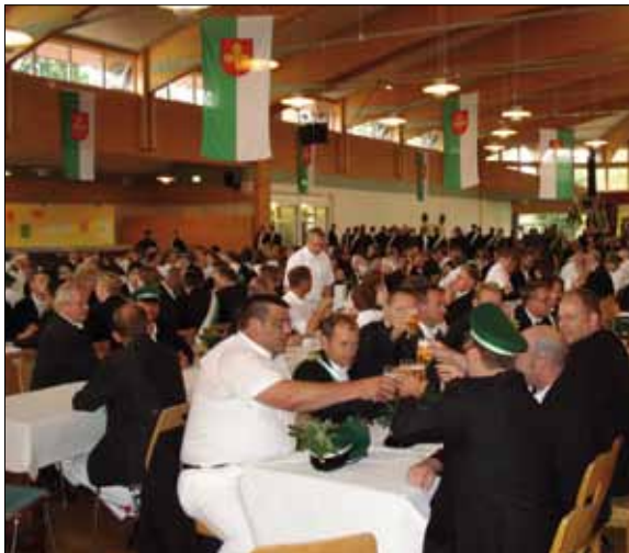
Schützenfrühstück in der Sälzerhalle.