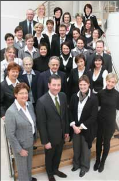
Neben der großen Auswahl an Markenmode und fairen Preisen setzt das Modehaus Dunschen in Delbrück auf geschultes Personal (Foto) in der Modeberatung und in der Schneiderei. Die meisten Mitarbeiter sind bereits seit vielen Jahren (oder sogar Jahrzehnten) in dem Familienbetrieb beschäftigt.

bei uns wohlfühlen“, hält das ganze Team an Altbewährtem fest. Persönliche Ansprache und ein freundliches Wort bleiben das Markenzeichen von Dunschen.