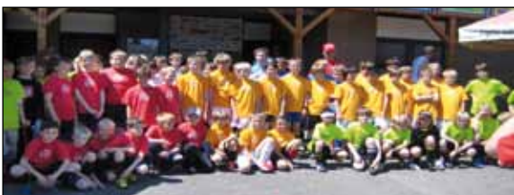
Die teilnehmenden Mannschaften kamen vom SV 03 Geseke, Haaren 2, Lipperode 2, Esbeck 2, Thüle, VfB Salzkotten sowie Verne 1, Verne