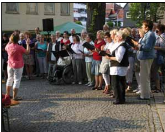
Musikalisch wurde der Abend von der Singgemeinschaft und dem Chor Adlibitum untermalt.