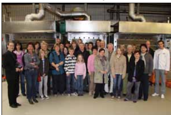
Über einen Hauptgewinn freuten sich 40 Familien aus Salzkotten, Paderborn, Delbrück, Wünnenberg, Geseke und Umgebung.

frischem Brot, Brötchen und Kuchen versorgt.