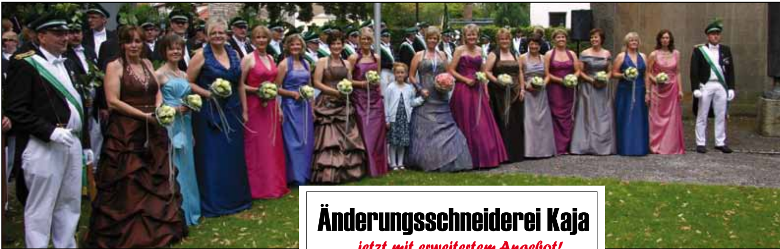
Der Hofstaat 2009 präsentierte sich in wunderbaren Traumkleidern in aktuellen Trendfarben den Fotografen. Auch 2010 können wir wieder auf solche Highlights hoffen.